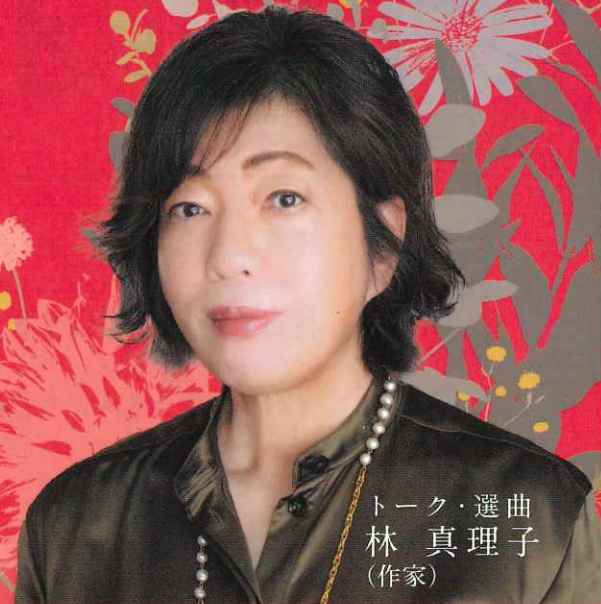
トーク・選曲 林 真理子 (作家)